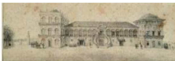
Litogravura – Palácio de São Cristovão residência oficial dos Imperadores do Brasil – Jean Baptiste Debret – século XIX

A Serigrafia começa a ser aplicada mais frequentemente por artistas na segunda metade do século XX. Como as técnicas descritas acima, também a Serigrafia apresenta diversas técnicas de gravação de imagem. Uma delas é a gravação por processo fotográfico. Imagens são gravadas na tela de poliéster e com a utilização manual de um rodo com a tinta a imagem é transferida para o papel.