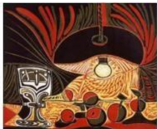
Linoleogravura – Vida abaixo da Lâmpada – Pablo Picasso – 1962

Linoleogravura é uma técnica que se assemelha ao entalhe da Xilogravura, no entanto, ao invés de madeira, a matriz é de material sintético – placas de borracha, chamadas “linóleo”.